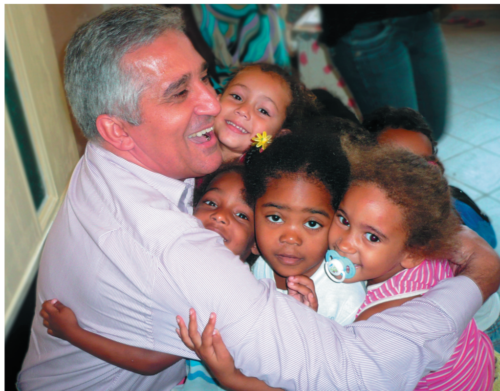
Educação Infantil, antiga prioridade de Comte, tem destaque no Plano de Educação do Estado

Em um prazo de seis meses, o estado deverá implantar o planejamento de expansão das instituições de Ensino Superior, considerando-se a seguinte distribuição: Região Metropolitana (Uerj e Uezo); Região Norte (Uenf); Região Noroeste (Uenf); Região Serrana (Uerj); Região das Baixadas Fluminenses (Uenf); Região do Médio Paraíba (Uerj); Região Centro Sul Fluminense (Uerj) e Região da Baía da Ilha